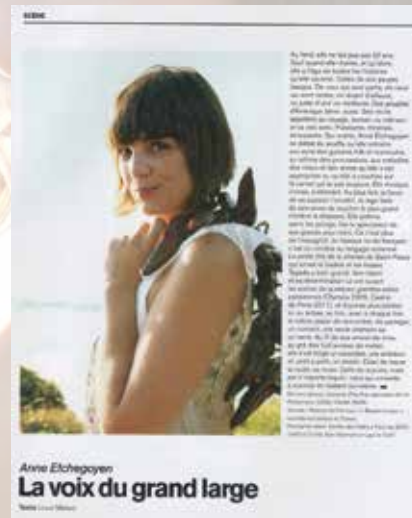
Parution, Attitude Rugby 2011