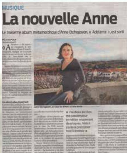
Parution, Sud Ouest Déc.2010