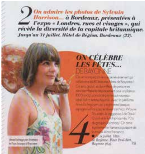
Parution, Elle 2011